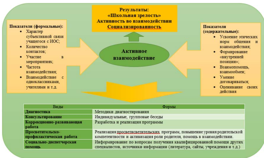
Рис. 1. Модель психолого-педагогического сопровождения детей с ОВЗ на этапе активного взаимодействия с инклюзивной образовательной средой школы

Представим модель психолого-педагогического сопровождения учащихся с ОВЗ (рис. 1)