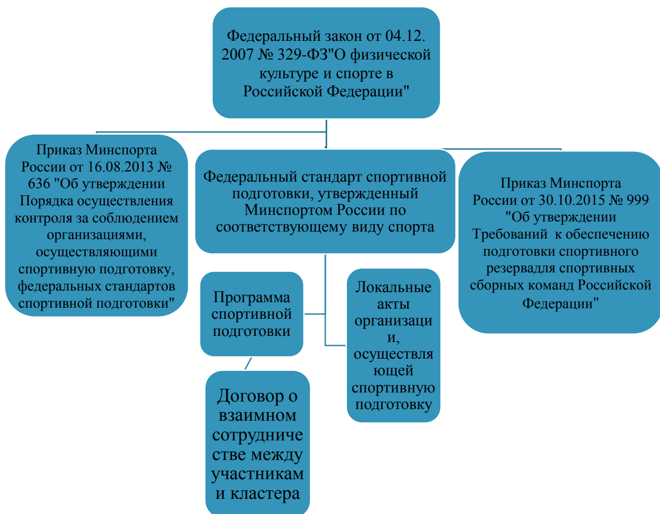
Рис.1. Схема нормативного правового сопровождения кластерной формы реализации программы спортивной подготовки

С учетом действующего законодательства, регулирующего подготовку спортивного резерва, на наш взгляд схема нормативного правового сопровождения кластерной формы реализации программы спортивной подготовки будет выглядеть следующим образом. (рис.1.)