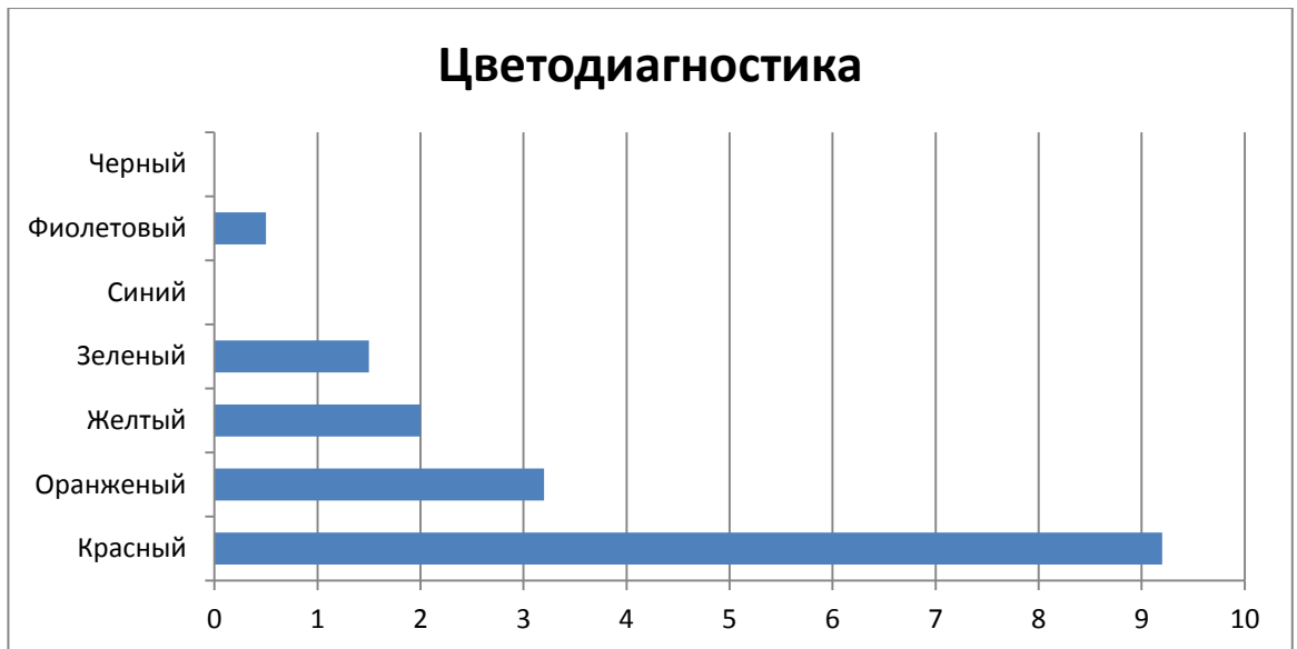
Рис. 3. Исследование по методике «Цветодиагностика эмоционального состояния» в АНО ДООЦ «Алые Паруса»