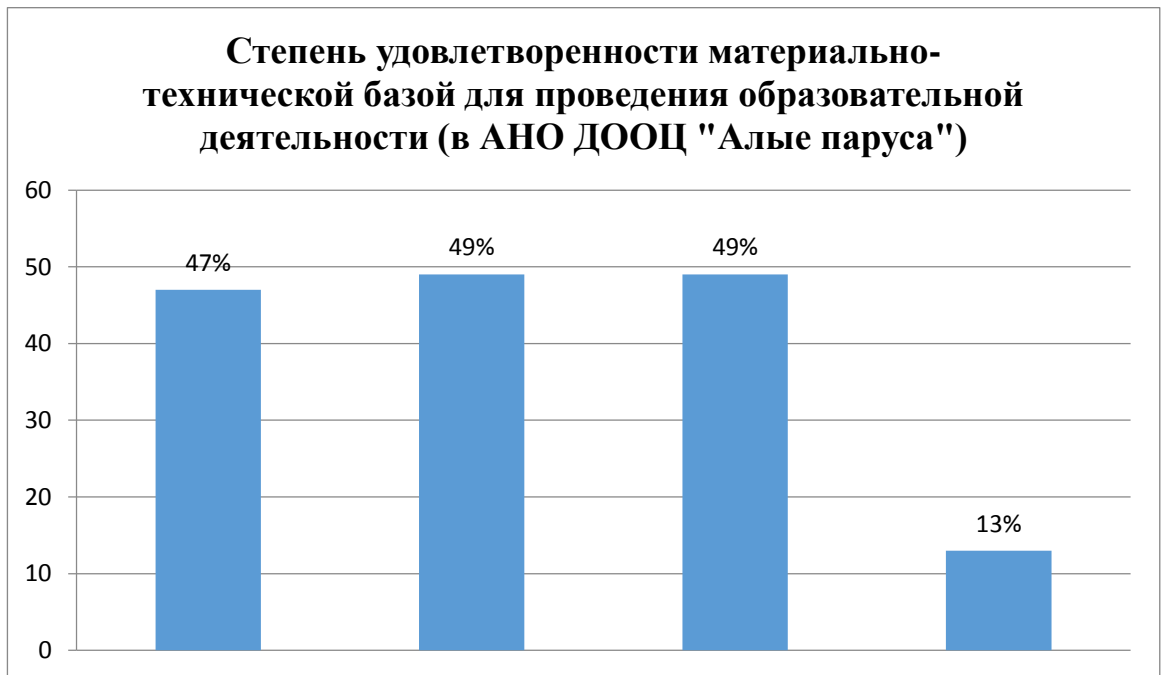
Рис. 1. Исследование степени удовлетворенности материально-технической базой для проведения образовательной деятельности в условиях пребывания в загородном лагере АНО ДООЦ «Алые паруса»

Около половины опрошенных учителей удовлетворены наличием библиотечного фонда в загородном лагере (47%), а также существованию развивающих игр (49%). Однако, некоторые респонденты отмечают, что возникали проблемы с классами для практических занятий, лабораторных исследований (13%) (Рис.1).