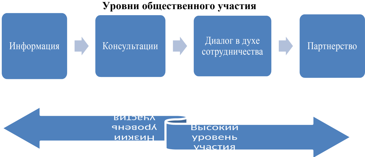
Рис. 2 иллюстрирует факт того, что любую ситуацию мы можем охарактеризовать через «низкий» или «высокий» уровень участия.

На практике могут возникать случаи, когда неудачный, неверный опыт органов власти сказывается на «торможение» для развития общественного участия. Существуют определенные позиции в отношении роли граждан в управлении делами государства. Приведем примеры.