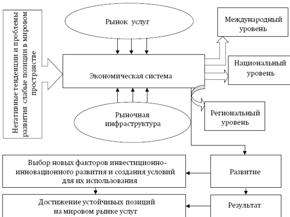
Рисунок 1 – Место рынка услуг в экономической системе (по Е.И. Макриновой)

организации, на которой действуют поставщики и потребители услуг. Схематически место рынка услуг в экономической системе выражено на рис. 1.