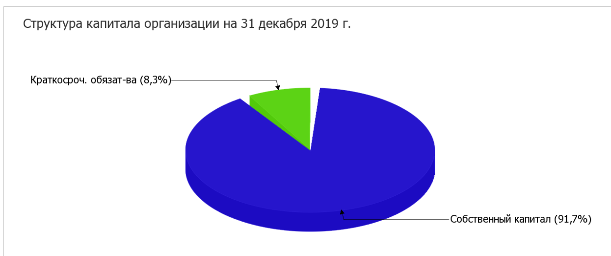
Рисунок 6 – Структура капитала МУП «Надежда» в 2019 г.

запасов, что характерно для стадии сворачивания деятельности. Наглядно структура капитала организации представлена на рис. 6