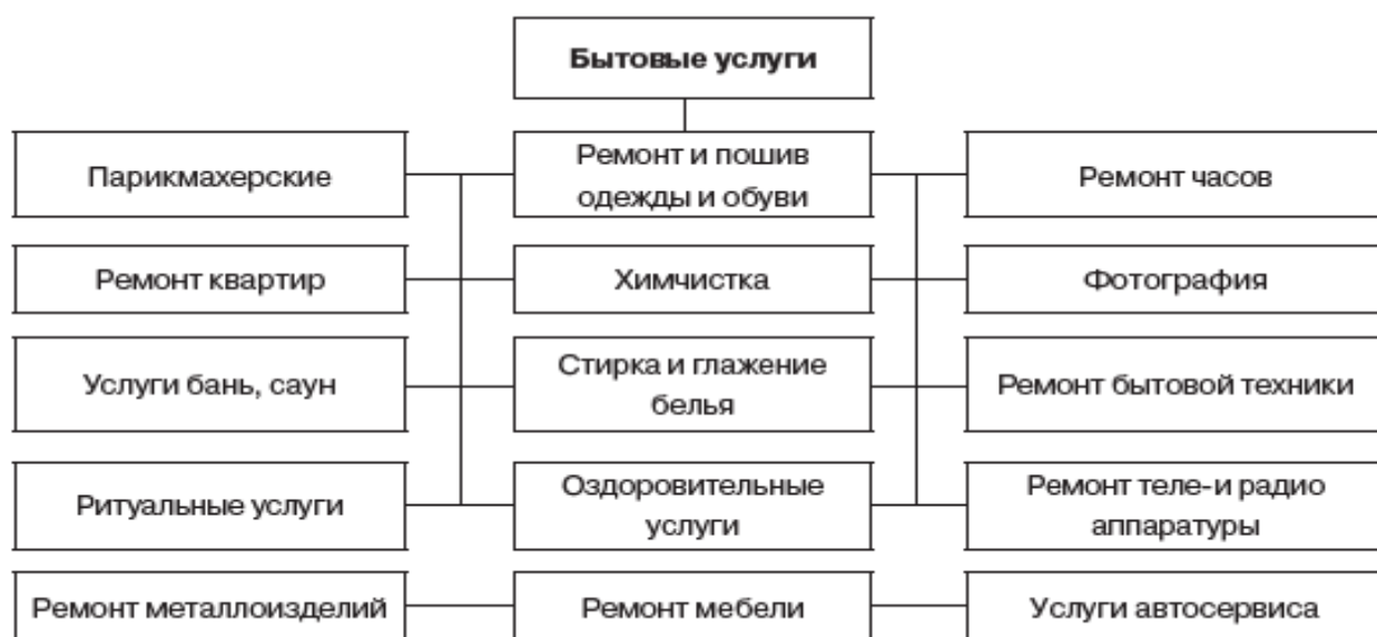
Рисунок 5 – Разновидности бытовых услуг [Система муниципального управления, с. 580]

и др.» [Гибадуллина и др., с. 75]. Такой подход позволяет лишь понять, что среди бытовых услуг наблюдается разнообразие деятельности, так как бытовые потребности человека потенциально безграничны и их относительно сложно классифицировать по направлениям и видам деятельности. К примеру, В.Б. Зотов приводит следующую схему разновидностей бытовых услуг населению (рис. 5)