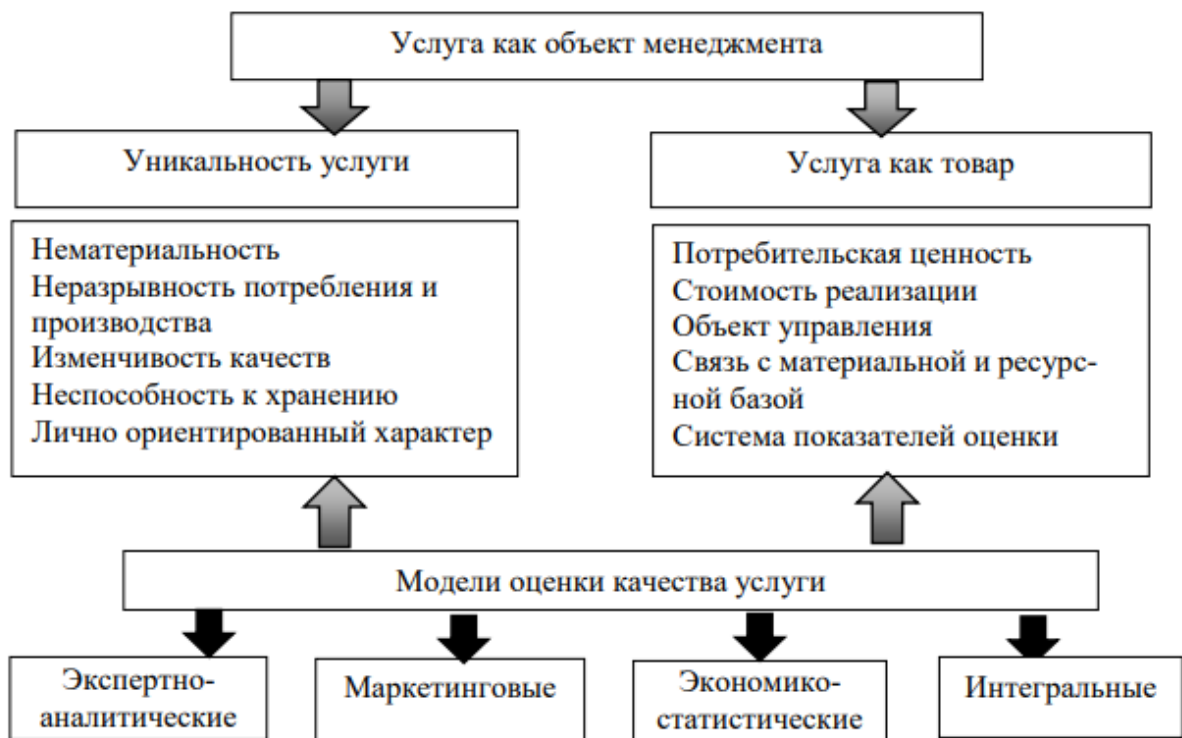
Рисунок 3 – Понимание услуги в качестве объекта менеджмента [Дышловой, С. 222]

Обращает на себя внимание, что услуга может пониматься как товар и как носитель уникальных свойств, ключевым среди которых выступает качество услуги. Можно также сделать вывод, что услуга выступает в качестве управляемого явления, то есть некоего объекта, на который можно воздействовать, добиваясь желаемого состояния. Схематически это можно выразить следующим образом (рис. 3)