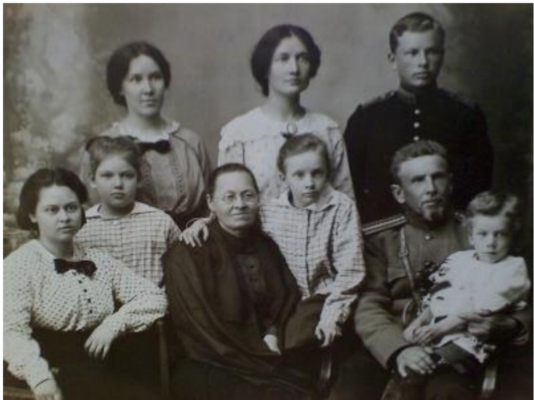
г. Санкт-Петербург