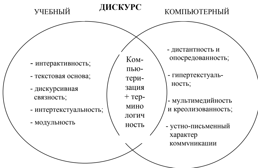
Рис. 1. Модель взаимодействия учебного и компьютерного дискурсов в ЭОР CCNA на основе их специфических параметров

В исследуемом ЭОР CCNA нами выявлены компьютерные параметры дистантности и опосредованности, гипертекстуальности, мультимедийности и креолизованности, устно-письменного характера коммуникации , а также учебные параметры – интерактивность, текстовая основа, дискурсивная связность, интертекстуальность (интердискурсивность) и модульность . Параметрами, связывающими учебный и компьютерный дискурсы в единую дискурсивную формацию, являются параметры компьютеризации учебного дискурса , или передачи посредством цифрового сигнала, и терминологичности наполнения дискурса . Графическая модель наложения учебного и компьютерного дискурсов в ЭОР CCNA представлена на Рис. 1: