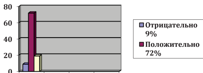
Диаграмма 5. Какие пожелания вы адресуете кредитным организациям?