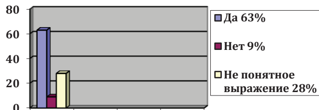
Диаграмма 4. Как вы относитесь к кредитованию?