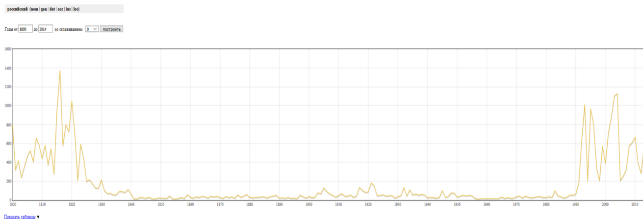
Рис. 2. График употребления слова «российский» 2