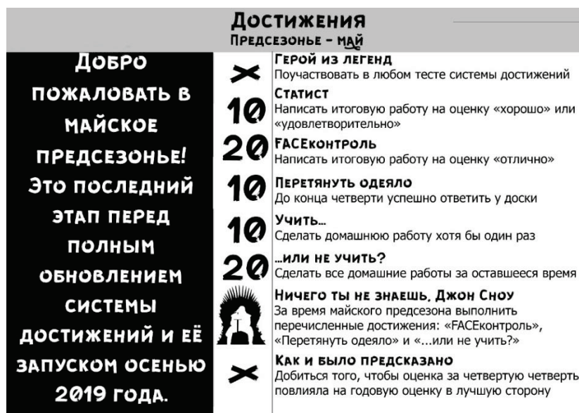
Рис. 9. Система достижений этапа 2.

системы достижений (см. рис ), в сравнении с этапом 1 (см. рис 2 в [1]). Критерии получения достижений значительно упрощены, ввиду ограничения по времени, а также для предоставления возможности получения учеником всех достижений.