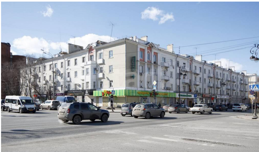
Рис. 2. Тюмень, ул. Республики, 58 Источник: [23].