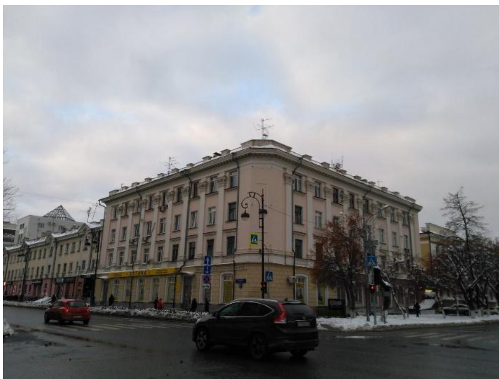
Рис. 4. Тюмень, ул. Республики, 45 Источник: [22].