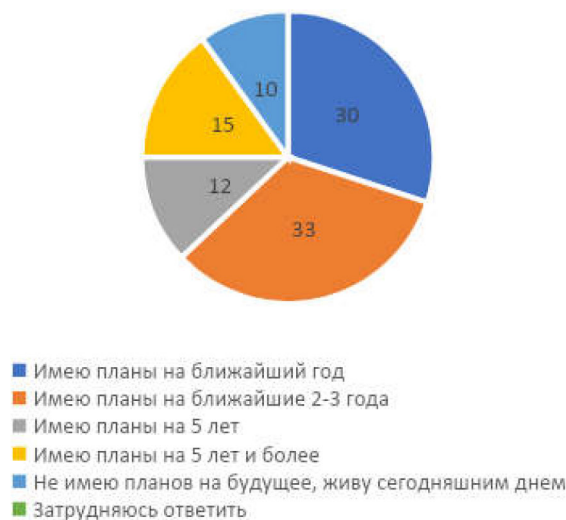
Рис. 3. Распределение ответов на вопрос: «Как бы Вы охарактеризовали свои горизонты планирования жизни?» (в % к числу опрошенных)