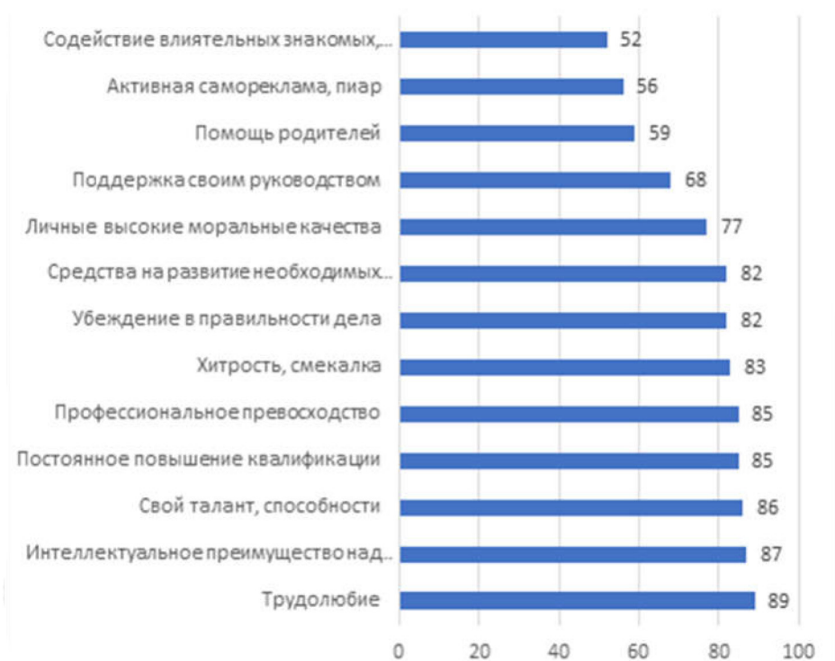
Рис. 2. Распределение ответов на вопрос: «Пожалуйста, назовите наиболее эффективные средства, способы стать победителем в профессиональной конкуренции» (варианты ответа: «очень важно» и «важно»; в % к числу опрошенных)

туального преимущества над конкурентами» (87%) и «свой талант, способности» (86%). Наименее значимыми средствами были признаны «содействие влиятельных знакомых, друзей» (лишь 52% старшеклассников назвали его «очень важным» или «важным»), «активную саморекламу, пиар» (56%), а также «помощь родителей» (59%). Таким образом, победу в профессиональной конкуренции учащиеся школ связывают в первую очередь с наличием определенных личных качества человека, его трудолюбием и активностью, а в наименьшей степени они связывают победу с поддержкой знакомых, друзей, родственников (рис. 2).