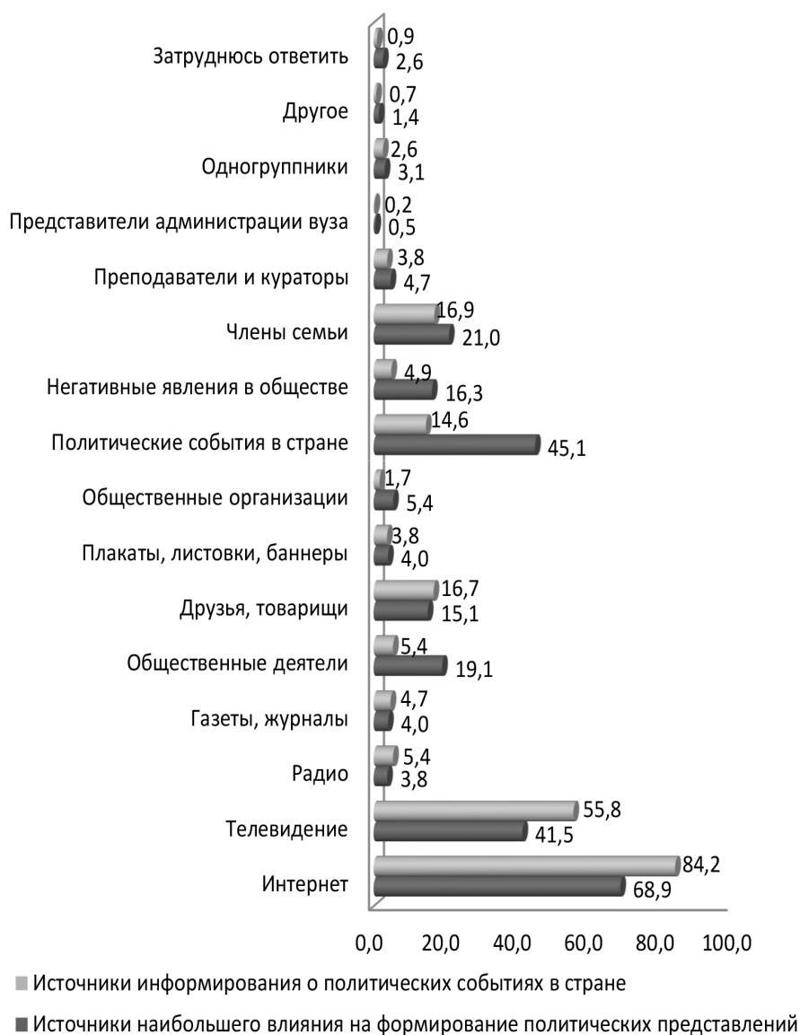
Рис. 2. Источники влияния на формирование у молодежи представлений о политической жизни* и источники получения информации о политических событиях** (в % к числу ответивших)