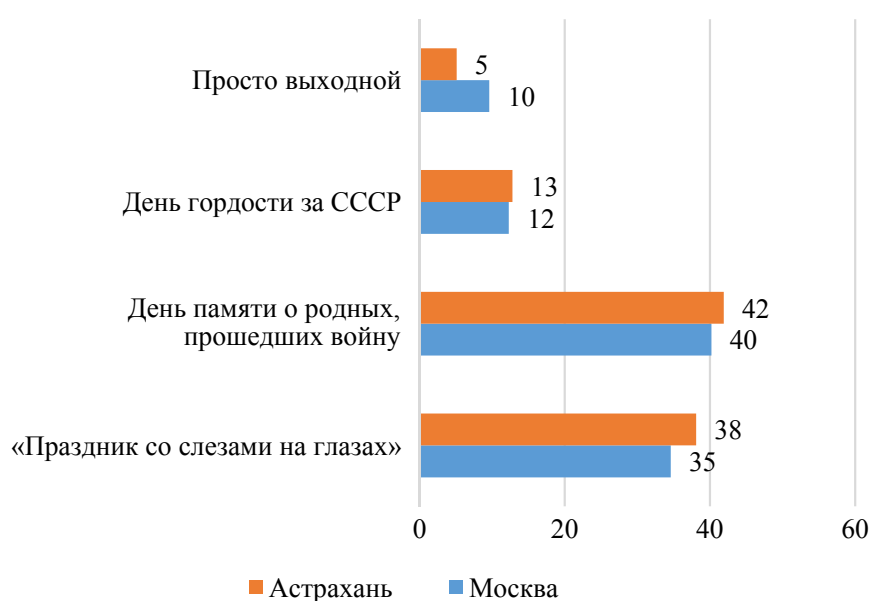
Рис. 4. Ответы студентов на вопрос «Чем для вашей семьи является День Победы?» (% от числа опрошенных)