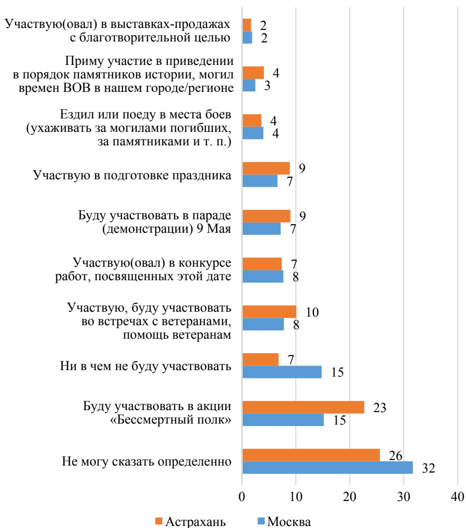
Рис. 8. Ответы студентов на вопрос «Как вы участвуете (будете участвовать) в подготовке и праздновании 75-летия Победы?» (% от числа опрошенных)

войны), пользуются большей популярностью среди астраханских студентов, чем московских (сумма по этим вариантам ответов в Москве 49%, в Астрахани — 63%). Среди выявленных отличий в двух городах следует отметить следующие: смотрят парад по ТВ на 5% больше студентов московских вузов, чем астраханских; среди астраханцев в два раза меньше тех, кто 9 Мая просто гуляет и отдыхает; участие в акции «Бессмертный полк» принимает каждый шестой студент Астрахани и каждый девятый студент Москвы.