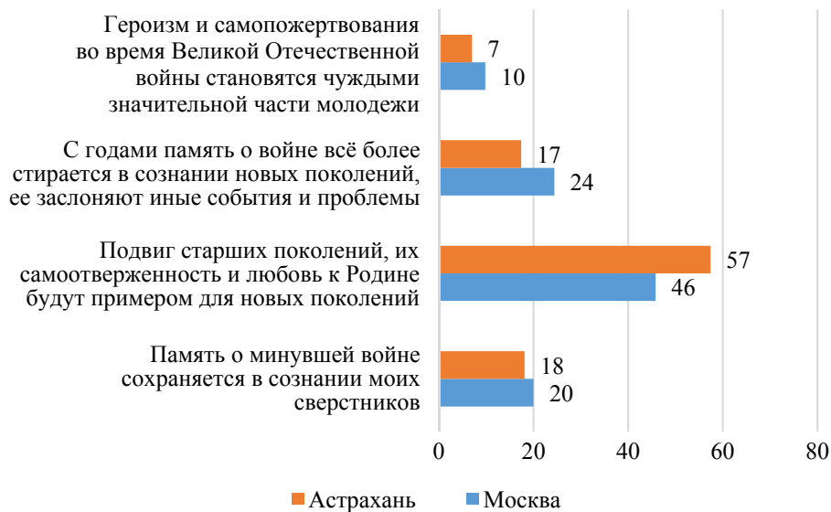
Рис. 1. Ответы студентов на вопрос «Приближается 75-летие Победы. Какие мысли и чувства вызывает у вас эта дата?» (% от числа опрошенных)