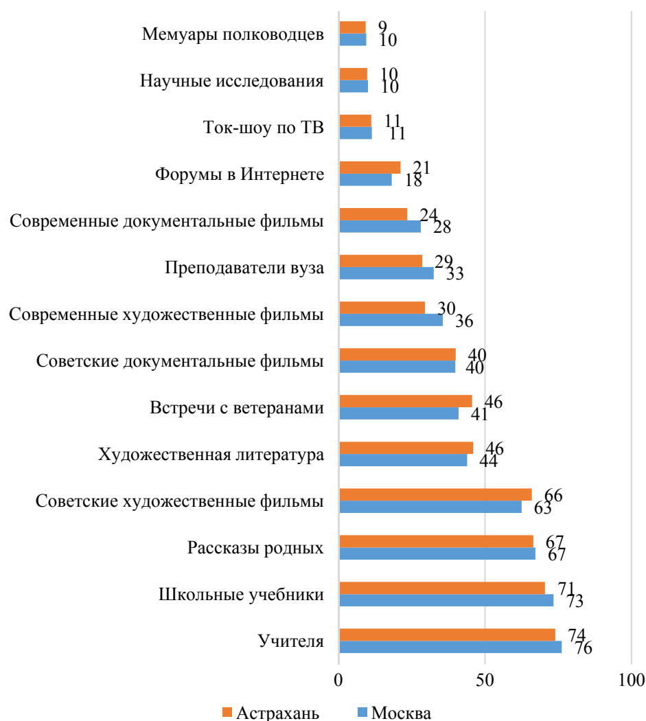
Рис. 2. Ответы студентов на вопрос «Из каких источников вы получили знания о Великой Отечественной войне?» (% от числа опрошенных)