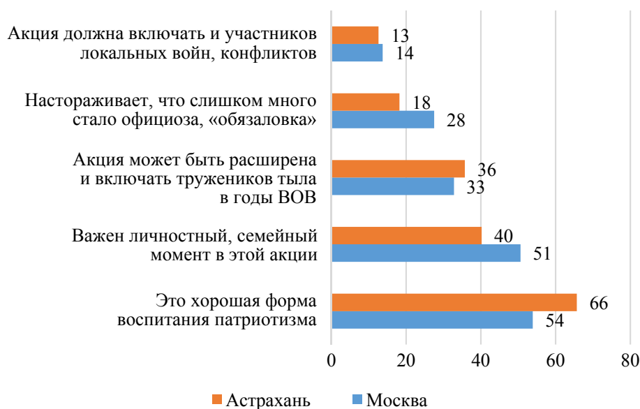
Рис. 5. Ответы студентов на вопрос «Ваше мнение по поводу акции «Бессмертный полк»?» (% от числа опрошенных)