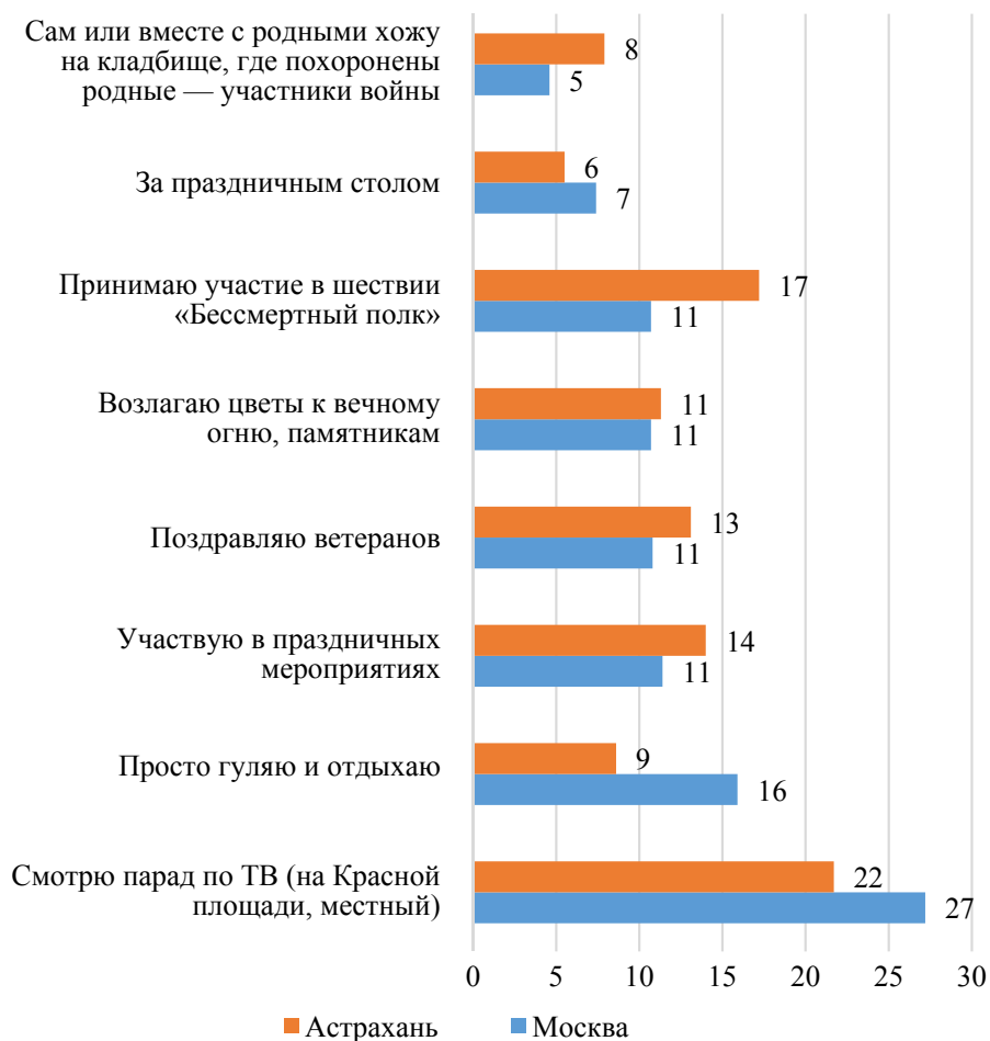
Рис. 7. Ответы студентов на вопрос «Как обычно вы проводите 9 Мая?» (% от числа опрошенных)

Самым популярным вариантом ответа на вопрос о том, как респонденты проводят 9 Мая (рис. 7), является просмотр парада по ТВ. Варианты, подразумевающие личную причастность (участие в праздничных мероприятиях, шествии «Бессмертный полк», поздравление ветеранов, возложение цветов к вечному огню, памятникам, поход с родными на кладбище, где похоронены родные — участники