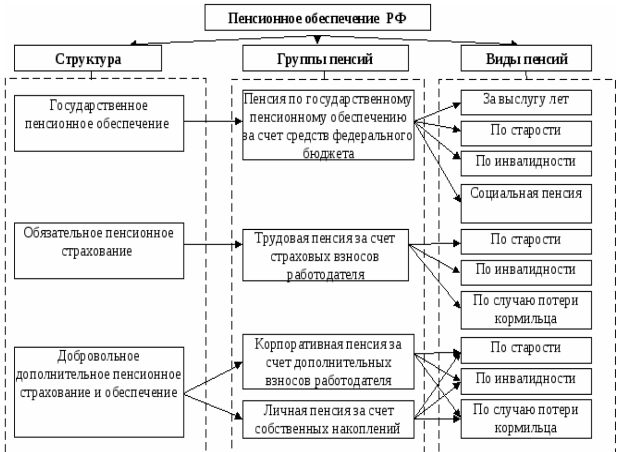
Рис. 4. Система пенсионного обеспечения в РФ