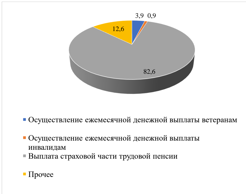
Рис. 2. Структура расходов Пенсионного фонда РФ в 2019 г., %

Расходы Пенсионного фонда России на выплату пенсий и пособий в 2019 году запланированы на уровне 6,172 трлн. рублей (это на 10,9 % выше, чем в 2018 году). Представим данные на рисунке 2.