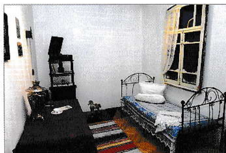
Экспонаты выставки «Эхо Великой Победы».

концу войны в РСФСР было образовано 14 новых областей — как отмечалось в официальных документах, с целью приблизить государственный и партийный аппарат к объектам управления, улучшить оперативное руководство народным хозяйством 19 .