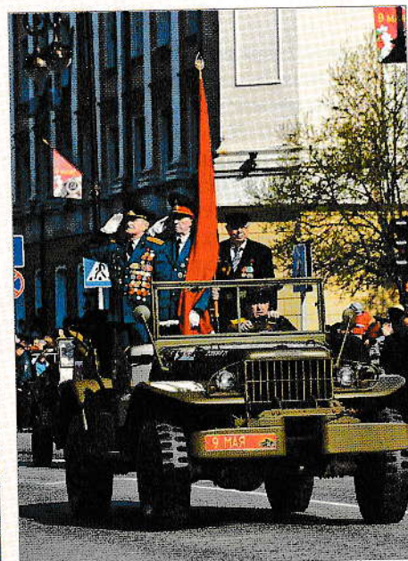
Тюмень. Празднование Дня Победы.

Н акануне войны Тюмень жила жизнью типичного провинциального города. Население его составляло около 76 000 человек, работали чуть больше 20 предприятий государственной промышленности и два десятка кооперативных артелей. Мощности семи электростанций не хватало для обеспечения потребностей города, и в 1939 году к электросети были подключены лишь 57,3 процента домов. С водопроводом дела обстояли ещё хуже — им могли пользоваться жители лишь 231 из 3800 домов. В основном тюменцы брали воду из 24 водозаборных будок. Из 180 километров улиц были замощены лишь 14, а освещены — 8,7. На весь город имелось всего 200 фонарей, да и те горели не всегда. Работали две коммунальных бани, одна гостиница, Дом крестьянина и 14 парикмахерских 1 . В городе было 187 торговых заведений и 38 столовых 2 .