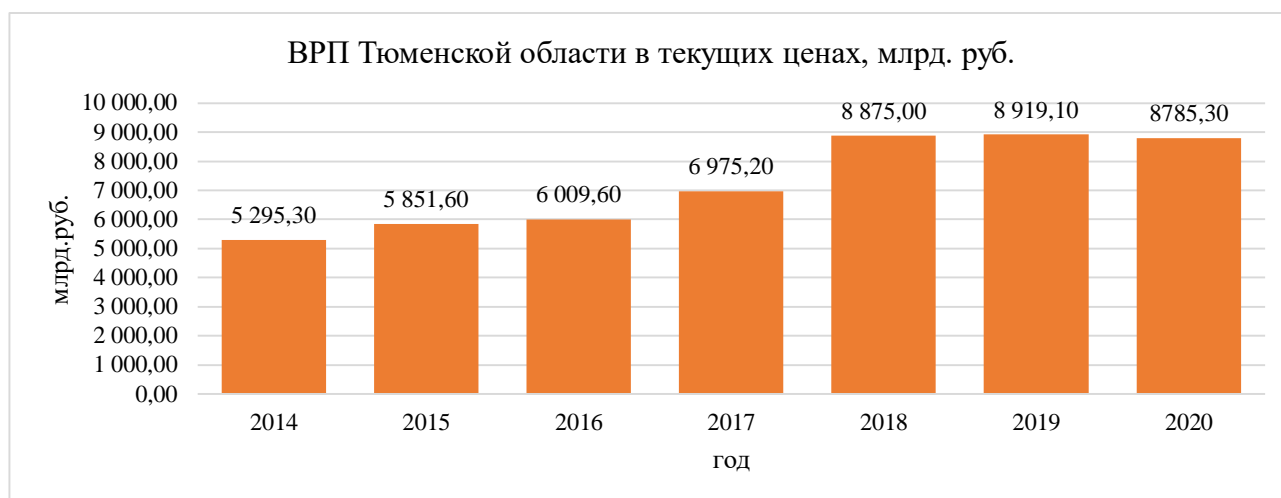
Рисунок 3. ВРП Тюменской области в текущих ценах за период 2014-2020 гг.

По данным таблицы 4 составим график изменения ВРП (в текущих ценах) Тюменской области за 2014-2020 гг. (рисунок 3)