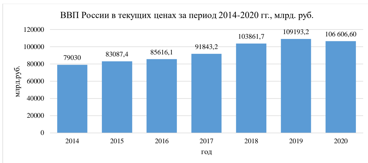
Рисунок 2. ВВП России в текущих ценах за период 2014-2020 гг.

По данным таблицы 3 для большей наглядности построим график динамики показателя ВВП России за период 2014-2020 гг. (рисунок 2).