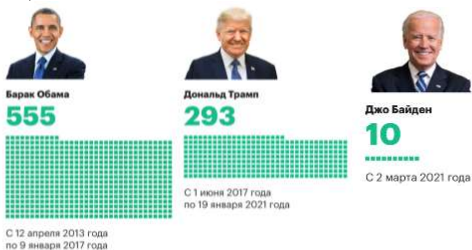
Рисунок 2. Количество санкций против России введенных президентами США

Из всего вышесказанного следует вывод о том, что санкции не являются столь необходимым инструментом для налаживания Российско-американских отношений, а лишь являются катализатором для возникновения ещё более отрицательных последствий в экономическом и политическом взаимодействии между странами. Рассматривая период начала правления Джо Байдена можно сказать, что процесс введения антироссийских санкций не останавливается, не видоизменяется, а лишь становится более частым и неоправданными. Многие вновь введённые санкции «проходят» по уже существующим ограничениям и лишь частично расширяют их, либо не представляют для Российской стороны должной затормаживающей экономические и политические процессы силой. Если рассмотреть количество введённых санкций и в какой период они были введены, то становится ясно, что пик реализации угрозы санкционного давления произошёл при правлении Барака Обамы (рисунок 2).