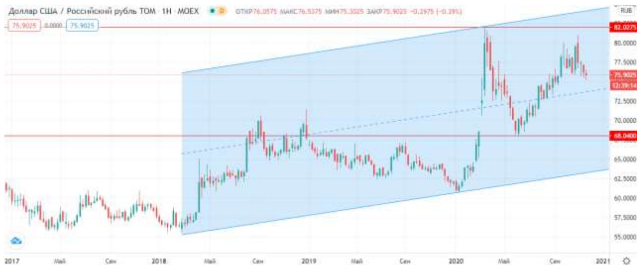
Рисунок 1. Технический анализ графика валютной пары доллар/рубль

– наращивание девальвационных рисков курса российского рубля (36% по мнению респондентов), подтверждением чему является график на рисунке 1, где проведен технический анализ валютной пары доллар/рубль.