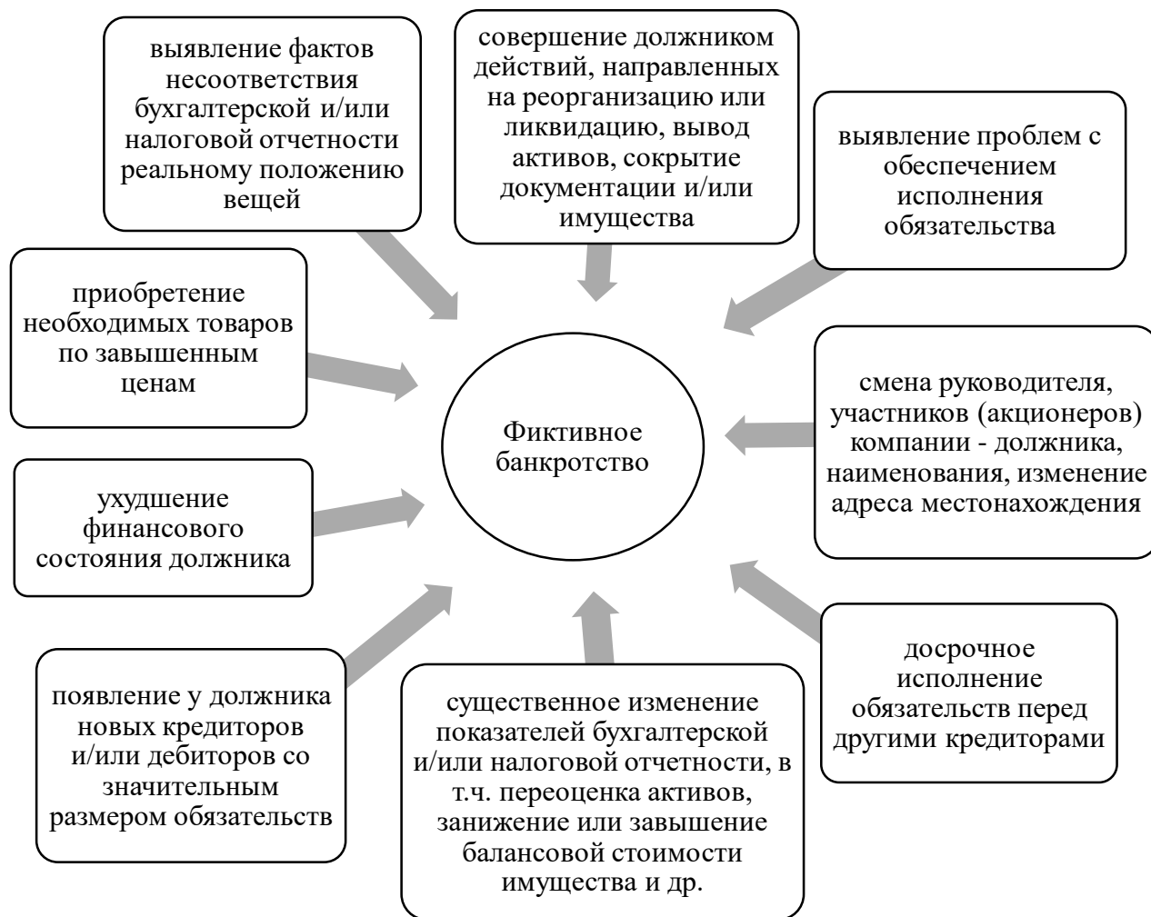
Рисунок 3. Признаки возможности фиктивного банкротства