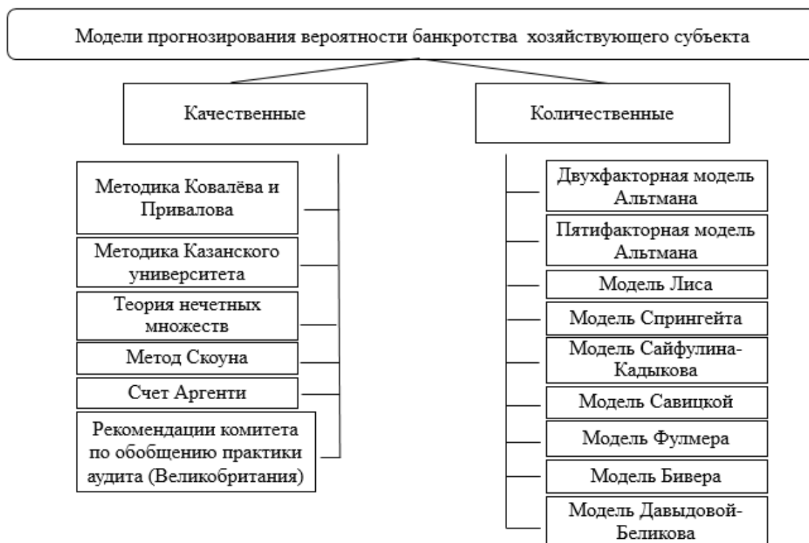
Рисунок 2. Количественные и качественные модели прогнозирования вероятности банкротства предприятия

Признаки финансовой несостоятельности можно отследить задолго до признания хозяйствующего субъекта банкротом. Существует большое количество различных моделей, позволяющих диагностировать вероятность наступления банкротства (рисунок 2).