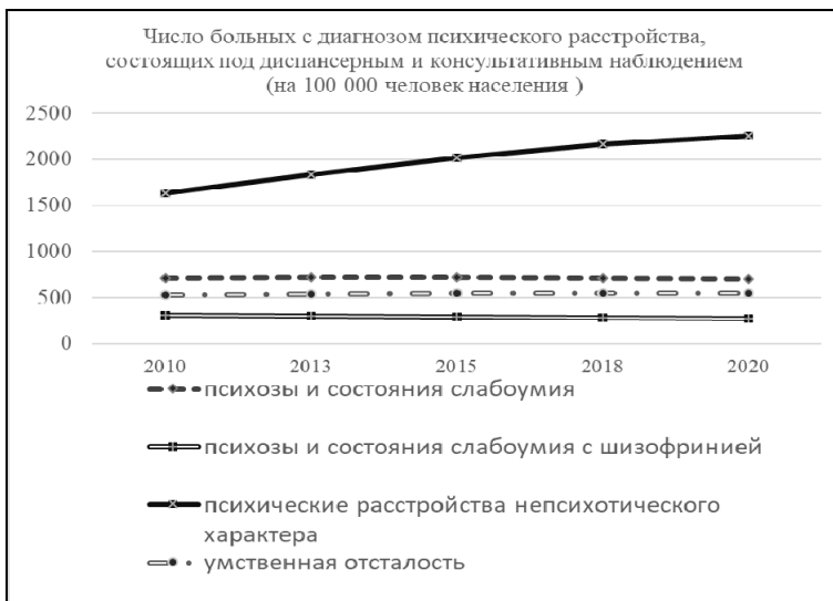
Рис. 3. Структура общей заболеваемости психическими расстройствами больных, на 100 тыс. человек населения