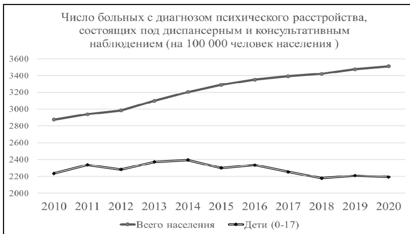
Рис. 2. Динамика заболеваемости всего и детского населения Республики Башкортостан психическими расстройствами, находящихся под диспансерным наблюдением, на 100 тыс. человек