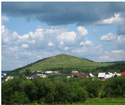
Рис. 2. Языческий сакральный ландшафт. Гора Городище, с. Ключи, Суксунский район, Пермский край

Сакральные ландшафты Суксунского района отличаются от таковых Чердынского района. В Суксунский районе проживают народы многих национальностей, принявших в ходе развития и исторического формирования христианство, что отражено в наличии православных культовых местах (церкви, часовни, святые источники) на этой земле, расположенных в большинстве своем на возвышенных местах, холмах, недалеко от речных водоемов в основном в пределах Тисовско-Суксунского ландшафта. Особенностью сылвенской земли является проживание здесь «сылвенских» мариинцев с их языческой верой, где основу представления о природе составляет так называемый «аграрный культ». Культовые святые места расположены в пределах речной долины р. Сылва Тисовско-Суксунского ландшафта на юго-востоке района.